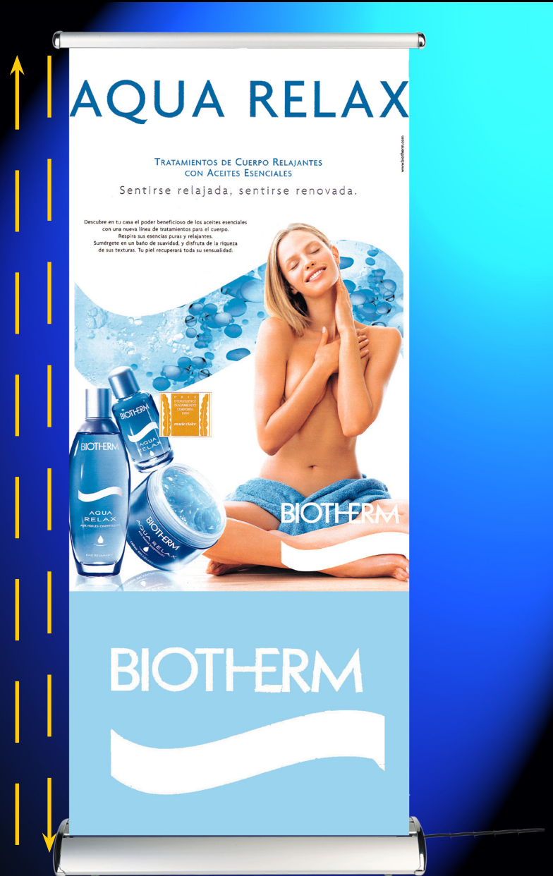
Roll'up Scrolling : image défilante en continu