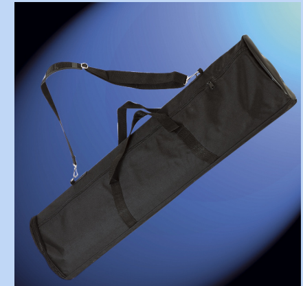
Sac de transport matelassé inclus