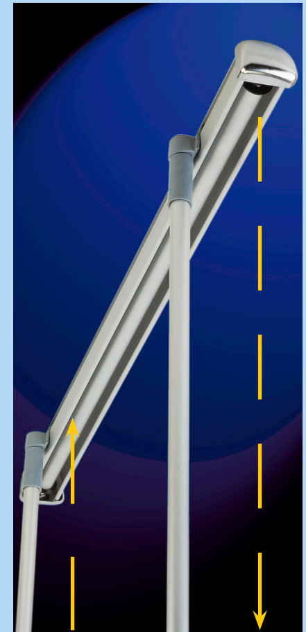
Cannes du Scrolling