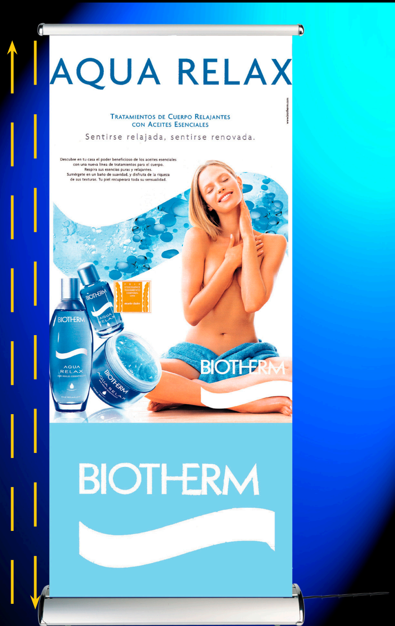
Roll'up Scrolling : image défilante en continu