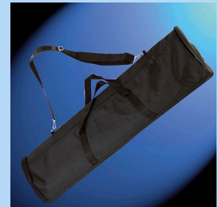
Sac de transport matelassé inclus